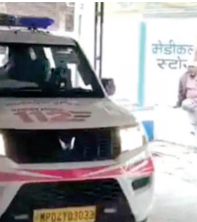
मारपीट करने के कारण उसकी पत्नी भी उसे छोड़कर चली गई थी। इस कारण आरोपी अपने घर में अकेला ही रहता था। फिलहाल आरोपी अब पुलिस हिरासत में है।